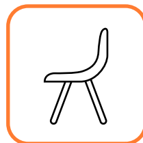
Soltanto posti a sedere (possibili eccezioni)